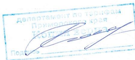
Таблица № 2